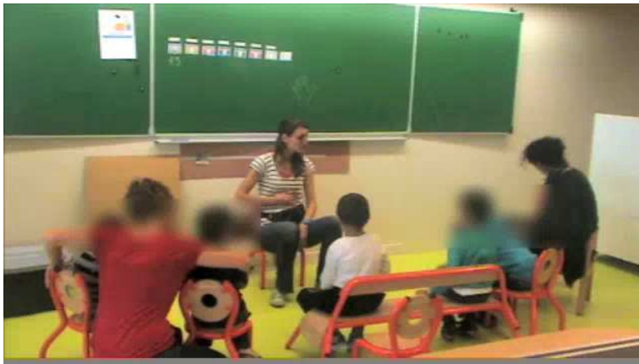
La chanson du repas

« Un lieu où on apprend ensemble pour apprendre à vivre ensemble »